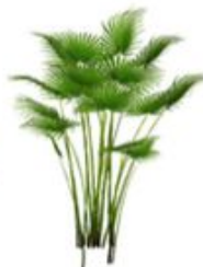
Palmier Trachycarpus Wagnerianus